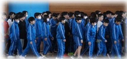
訓練の時だけでなく、毎日の生活から、6年生がよい見本となって行動しています。

本校では、命を守る行動として、次のことを大切にしています。 話を聞く・素早い集合・無言移動