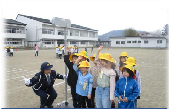
信号を使つての歩行練習に取り組む1年生

4月15日(水)、全校が参加しての交通安全教室を開催しました。1年生とかがやき学級は校庭を利用したの歩行実技練習に、3・5年生は自転車実技練習に、2・4・6年生はDVD視聴での交通安全学習に取り組みました。当日は、盛岡市交通指導員の皆さん、交通安全教育専門員の皆さんに加え、津志田小学校PTA校外生活委員会の方々にもご協力をいただき、学習を進めることができました。ご協力いただいた皆さん、ありがとうございました。