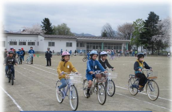
自転車実技練習に取り組む5年生